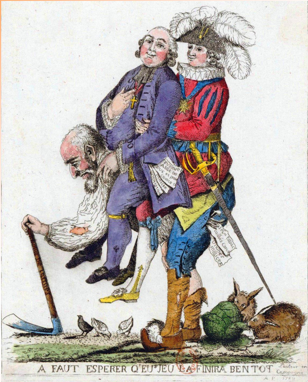
A FAUT ESPERER Q'EU JEU LA FINIRA BENTOT